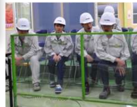
電気体感コーナー