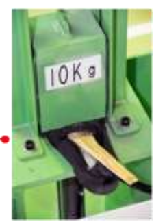
一般作業体感コーナー