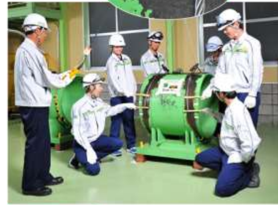
玉掛け作業体感コーナー