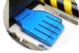
回転体体感コーナー