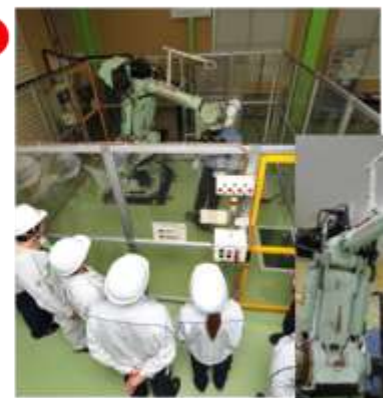
柵内作業体感コーナー